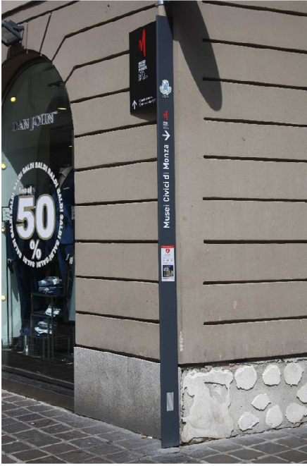
160 pali intelligenti