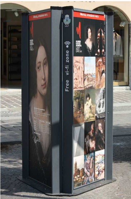
9 totem smart